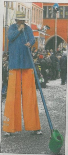
Der SWR-Steelman blies auf den ungewöhnlichen »Alphorn«...