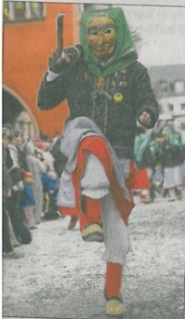
den Hexen den Marsch.