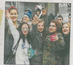
...ebenso wie das Publikum am Straßenrand.

Die Stadtverwaltung Lahr sprach in einer Pressemitteilung am späten Sonntagnachmittag in einer ersten Bilanz von einem »friedlichen Narrenfest«. Vom Deutschen Roten Kreuz mussten 17 Personen versorgt werden; dreimal musste der Notarzt ausrücken.