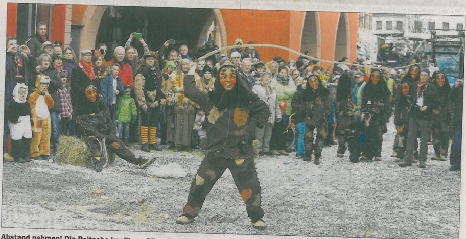
Abstand nehmen! Die Peitsche knallt am Alten Rathaus.