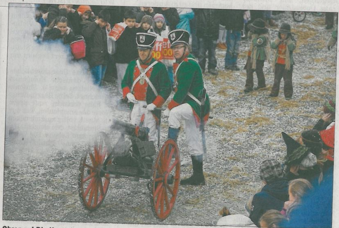
Ohren zu! Die Kanoniere schießen