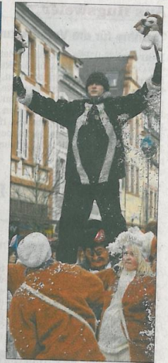
Ausgelassene Fasnachtsfreude: Die Narren jubeln...