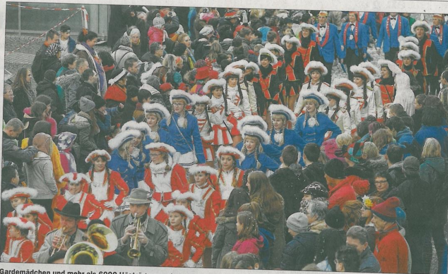
Gardemädchen und mehr als 6000 Hästräger sorgten am Sonntagnachmittag für ein buntes Bild in der Lahrer Innenstadt. Das SWR-Fernsehen übertrug den rund vierstündigen Umzug live.