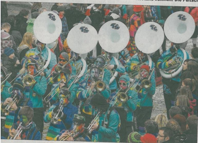
Dröhnung voraus mit den Hübelschänzern aus dem Hanauerland.